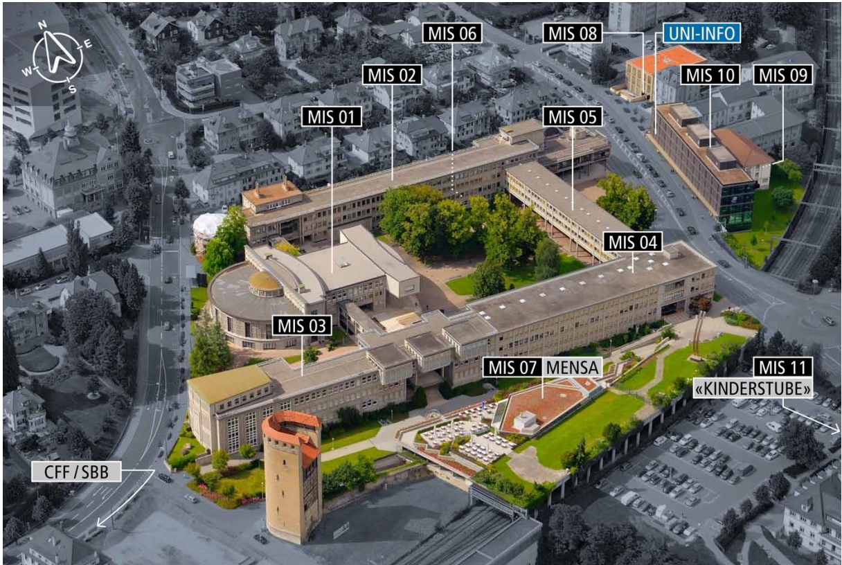
Übersicht: Gebäude der Universität Freiburg (Misericorde)